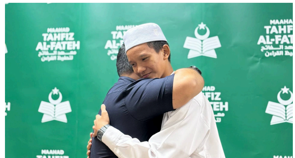
Gambar sekitar Majlis Doa & Khatam Hafazan 30 Juz Al-Quran