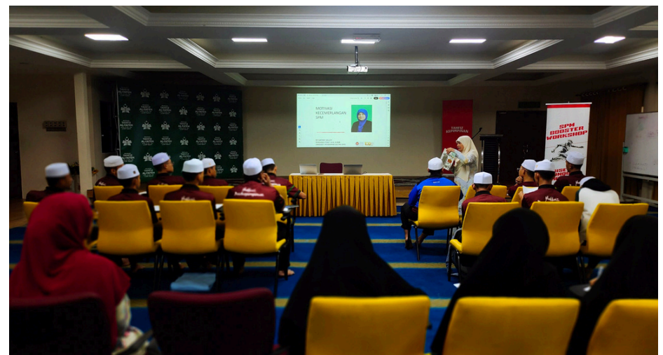
Gambar sekitar Program SPM Booster Talk