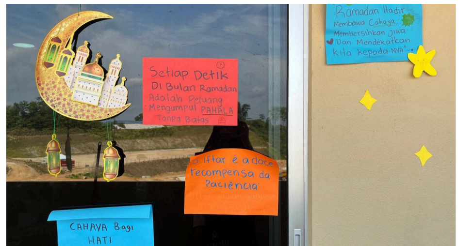
Gambar sekitar Program Ihya' Ramadan