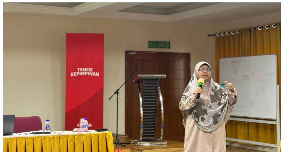
Gambar sekitar Kursus LADAP Guru 2.0