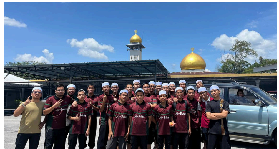
Gambar sekitar aktiviti Gotong-Royong di Masjid Sungai Masin