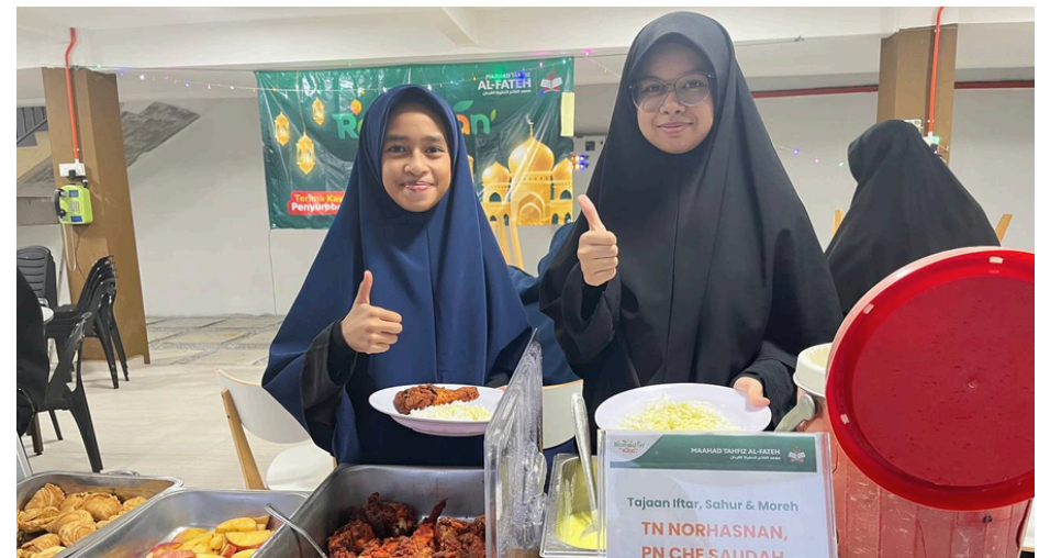
Gambar sekitar iftar jamaie hasil sumbangan para penyumbang