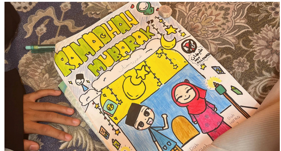
Gambar sekitar aktiviti Program Ihya Ramadan