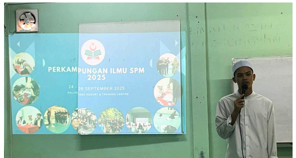
Gambar sekitar Perkampungan Ilmu SPM 2025