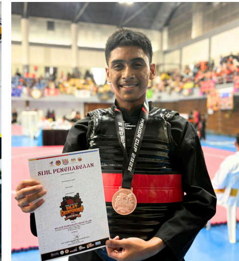
TAHNIHAH 13 PELAJAR AL-FATEH KE SHAH ALAM CITY SILAT CHAMPIONSHIP 2.0 MAYOR CUP 2025

Syabas kepada 13 pelajar Al-Fateh yang telah mewakili Persatuan Silat Hang Tuah Malaysia dalam Shah Alam City Silat Championship 2.0 Mayor Cup 2025!