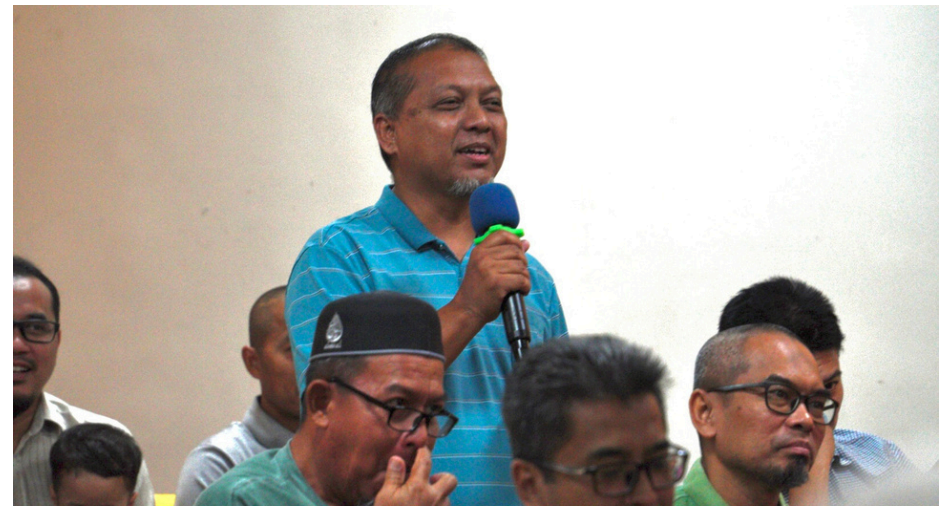
Gambar sekitar Mesyuarat PIBG